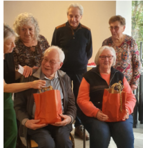
Nos doyens du jour